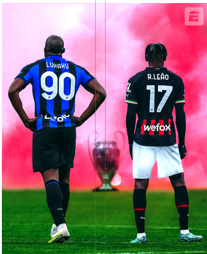
INTER VS AC MILAN

El Derby della Madonnina es uno de los partidos más esperados en el fútbol italiano, por la gran rivalidad que comparten estos clubes. Al Inter le toca ser local este fin de semana, sin embargo, ambos equipos comparten el mismo recinto.