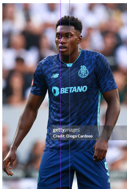
VITÓRIA GUIMARÃES VS FC PORTO

Los Neroazzurri son los actuales campeones de la Serie A y han tenido un inicio un poco más regular que el de los "visitantes".