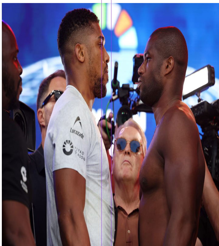
DANIEL DUBOIS VS ANTHONY JOSHUA

Este sábado le toca ser local ante el Porto, uno de los clubes más fuertes. Ambos conjuntos acumulan 12 unidades en las primeras cinco fechas, así que todo puede ocurrir en el estadio Dom Afonso Henriques.